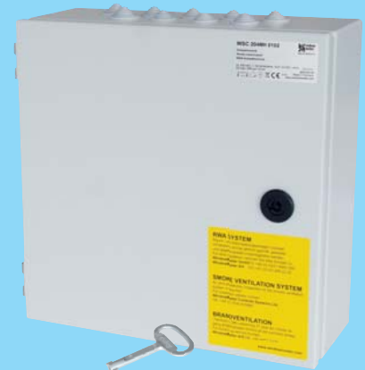
WSC 204MH: öffnen bei RWA, Stahlblechgehäuse