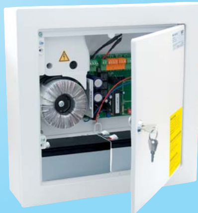
WSC 204: öffnen bei RWA WSC 204BZ: schließen bei RWA