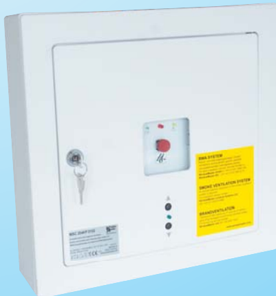
WSC 204KP: öffnen bei RWA, mit Auslösungstaster und Komfortbedienung